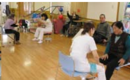
リハビリ訓練風景