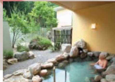
大自然に包まれて心なごむ露天風呂