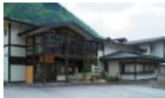
▲職員寮「コーボ穂高」