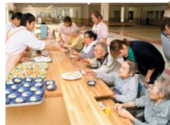
お菓子バイキング

また、毎月のお誕生会やお菓子バイキングのほか、お花見、もちつき大会、納涼祭などのアットホームな活動を通じ心温まるほのぼのとしたふれあいを大切にしています。