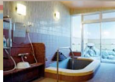
4~5人で入っても広いスペースの家族風呂