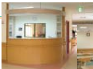
サービスステーション