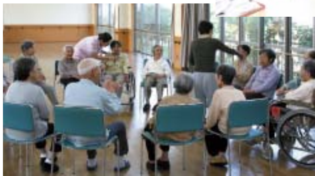
レクリエーション(カラオケ)