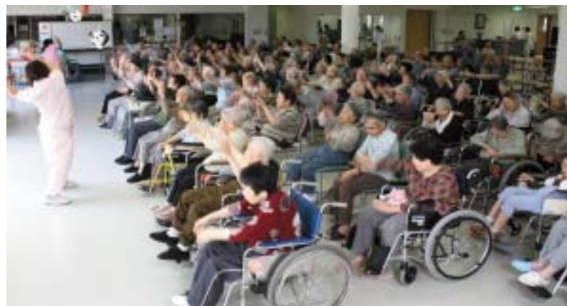
レクリエーション(体操)

医療・看護・介護の分野で充実した専門スタッフが、健康状態のチェック、お一人おひとりの日常生活に合ったケアを行います。 また、遊びと機能回復を兼ねたレクリエーションや適度な運動等を取り入れ、それぞれが生きがいや楽しみを持ち続け、健康でいきいきと楽しくお暮らしいただけるようご支援いたします。