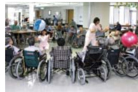
レクリエーション(ボール遊び)