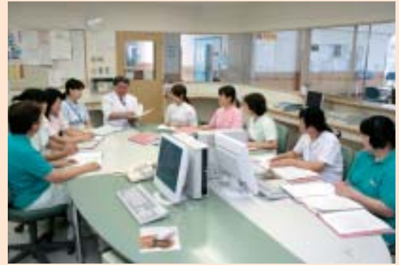
カンファレンス風景

入所定員 130名 （一般棟...80名 認知症専門棟...50名） 通所リハビリテーション 50名 （朝、夕送迎、リハビリ、食事、入浴などをお世話します。）