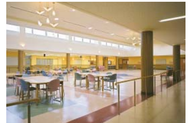
デイルーム（認知症専門棟）