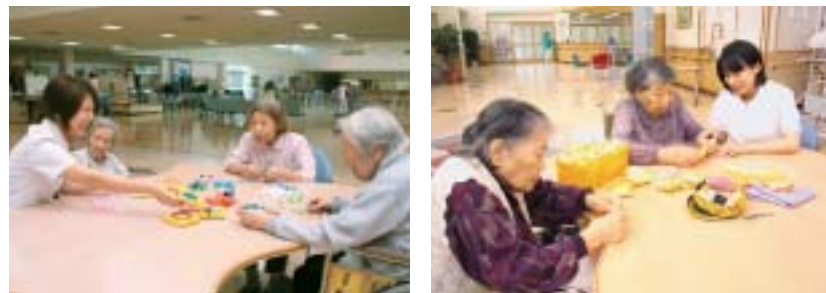
趣味を通してのリハビリテーション