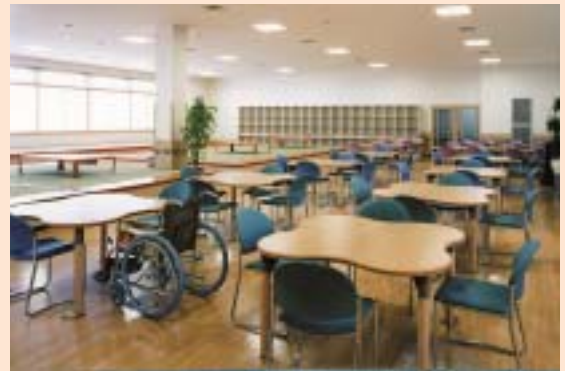
通所者デイルーム