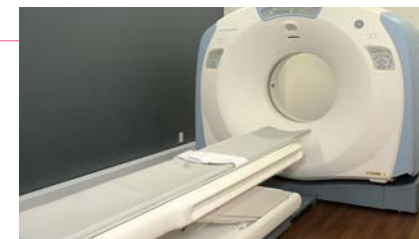
低被曝の8列マルチスライスCT