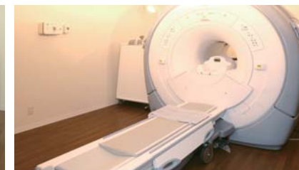
1.5テスラの高度な解像度を持つMRI