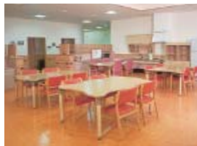
食堂・談話コーナー