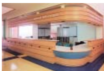
スタッフステーション▲